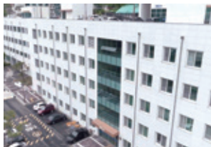
❾ 국제관 별관